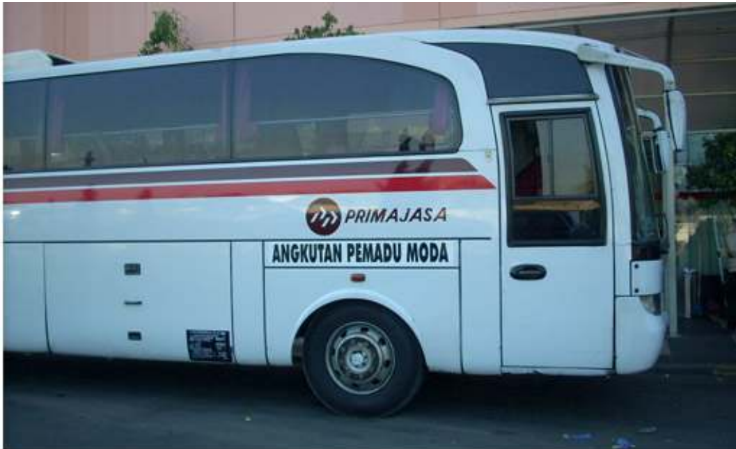
Antara perkhidmatan bas dari Bandara(Airport) Jakarta ke Bandung Super Mall