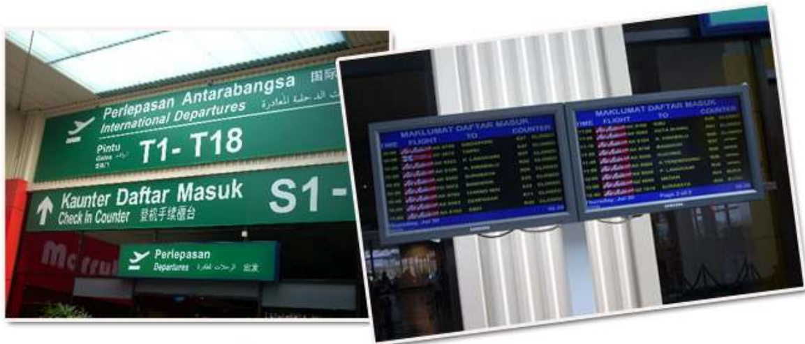
Pintu Masuk Utama di LCCT, Kuala Lumpur. Pastikan anda melihat Jadual Penerbangan di sini

Dari Kuala Lumpur ke LCCT anda boleh menaiki Skybus atau Aerobus dari KL Sentral dan StarShuttle dari Puduraya. Perjalanan mengambil masa sekitar satu setengah (1½) jam dengan tambang antara RM 8 dan RM 9 sehala. Pastikan anda memperuntukkan masa secukupnya untuk tiba awal bagi mengelak sebarang kesulitan. Anda dikehendaki berada di LCCT dua jam lebih awal sebelum waktu berlepas.