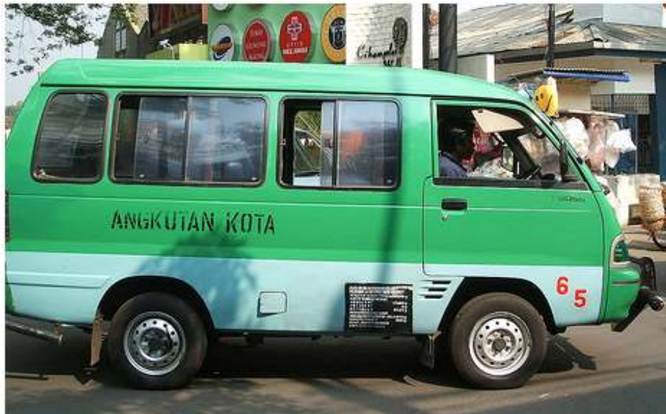
Angkutan Kota @ Angkot adalah Pengangkutan Awam yang popular Harga hanya Rp 2,000 untuk satu perjalanan