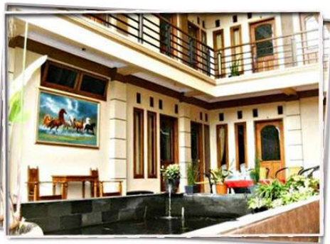
Orange Homes (MelayuResidence). Babakan Jeruk 1, No 76, Pasteur Harga dari Rp 175,000 - 550,000. Tel: 6281221010336 Web: Kampung-melayu.ning.co