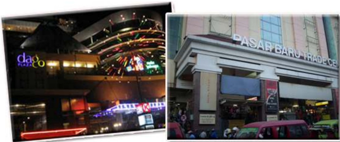
Antara Pusat Membeli-belah utama di Kota Bandung

Nota: Tempat strategik dan suasana nyaman