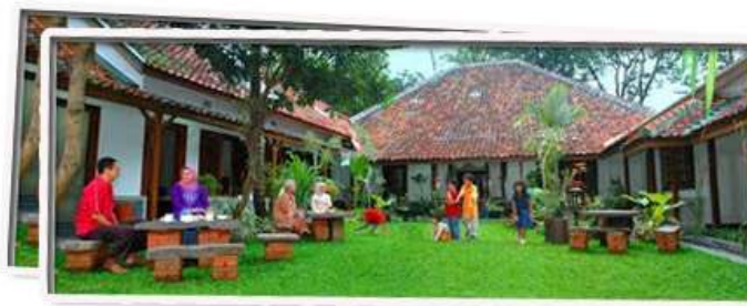
Rumah Ebo Jln Imam Bonjol 27, Bandung Tel 62 2222533773 Email: rumahebo@yahoo.com Web: rumahebo.wordpress.com