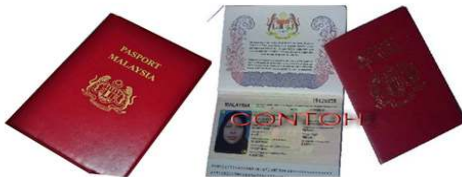
Passport Antarabangsa Malaysia