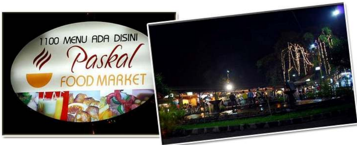
Food Court-Paskal Food Market, Hyper Square, Jl Pasir Kaliki Terdapat + 50 Stall & Live Band

Selain dari lokasi yang dinyatakan di atas, anda juga mempunyai lain-lain pilihan. Bagi memudahkan anda memilih restoran(Rumah Makan@ RM), saya akan menyenaraikan mengikut kawasan;-