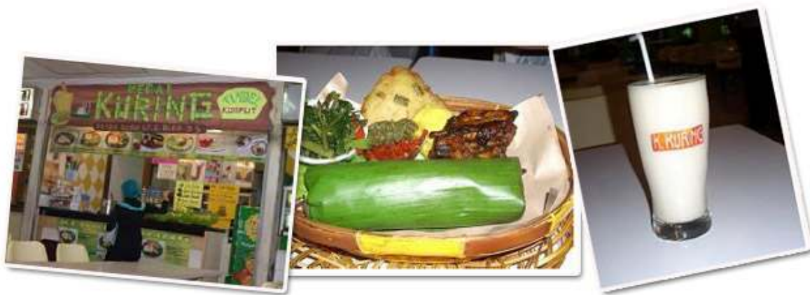
Menu popular di Food Court Tingkat 6, Pasar Baru Nasi Timbel Komplit Rp7,000 & Es Durian Belanda Rp 7,000

Banyak terdapat Food Court disitu dengan berbagai jenis makanan. Harganya juga murah. Antara masakan popular ialah Nasi Timbel. Nasi Timbel adalah Nasi putih yang disertakan dengan Ayam Bakar/Goreng, Ikan masin, Sambal, Tauhu, Tempe dan Ulam Salad. Harganya antara Rp 12,000 – Rp 14,000. Minuman di sini memang menyegarkan. Antaranya air buah atau dikenali dengan ES...(Oren, Durian Belanda ,Avocado,Strawberry dll).