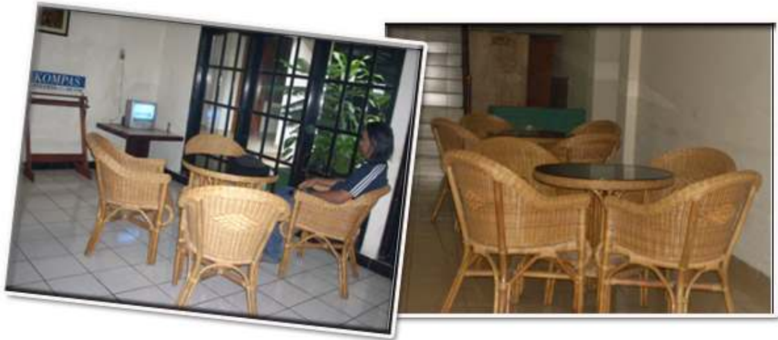
Ruang Santai di Astria Graha, Jln Dalem Kaum, Bandung (Penginapan Bajet Pilihan)