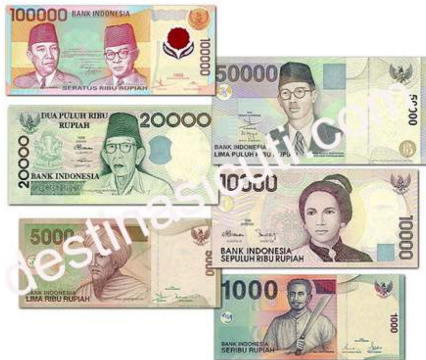
Contoh Nilai Rupiah Indonesia