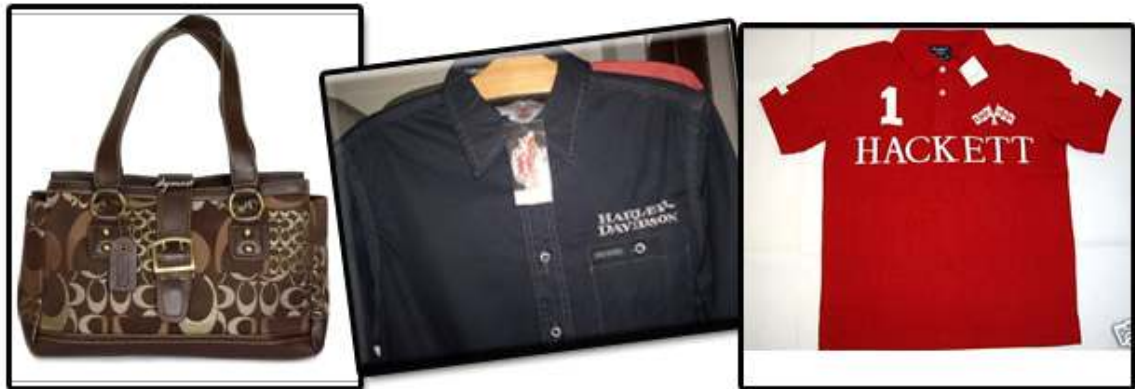
Produk yang mendapat perhatian pelancong dari Malaysia